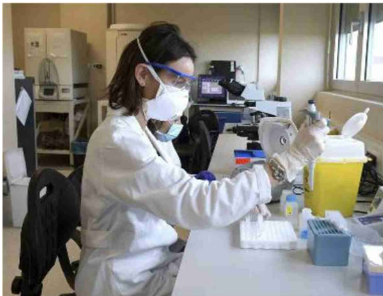
Alta tensione sulla chiusura dei laboratori analisi periferici

«L'Ordine dei medici afferma che i Poct vanno utilizzati solo per l'emergenza»