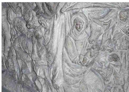
A destra, il presepe «sulla strada» a Vidiciatico. A sinistra, l'Adorazione dei pastori nell'atrio della Cassa di Risparmio in Bologna. A lato, l'opera di Simonetta Tedeschi nella Rassegna degli «Amici del presepio»