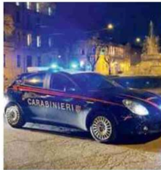
Il sequestro 120 grammi di marijuana