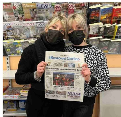
Tante le edicole aperte questa domenica sul territorio

INFORMAZIONE 'SANA' Approfondimenti, inchieste e lotta alle fake news con servizi su tutta l'area metropolitana