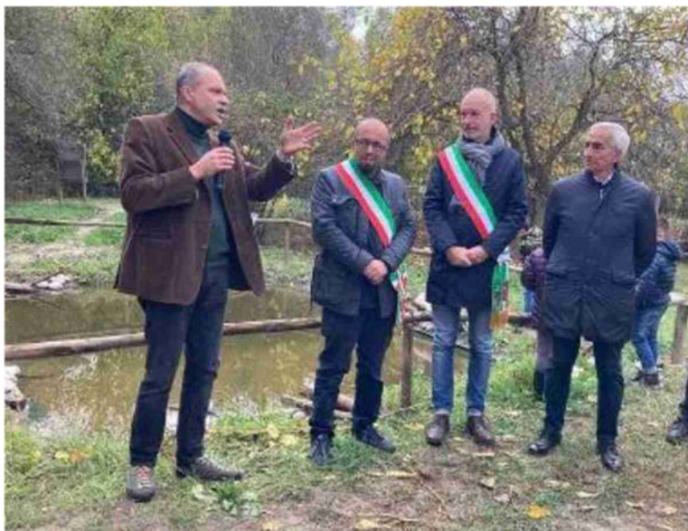
L'inaugurazione della Golena San Vitale riqualificata