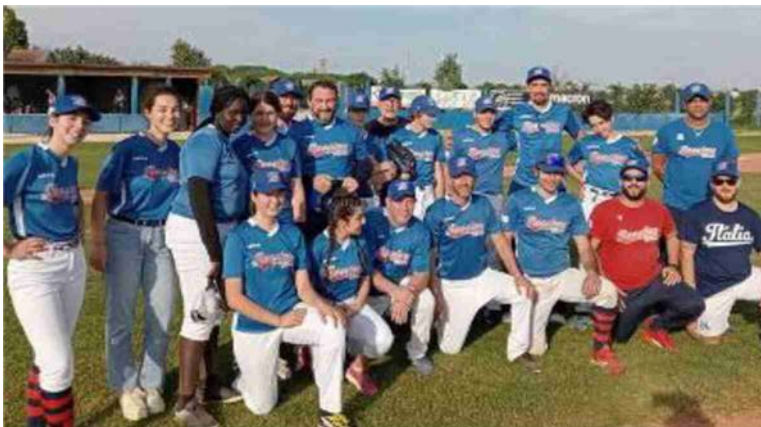
Il New Faenza Baseball è una realtà in continua crescita

Ha ben 30 iscritti e comprende giocatori di tutte le età: dai ragazzi di 14 anni alle 'vecchie glorie'