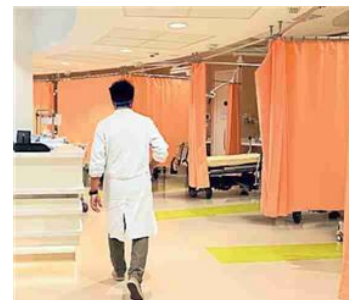
Un medico in corsia