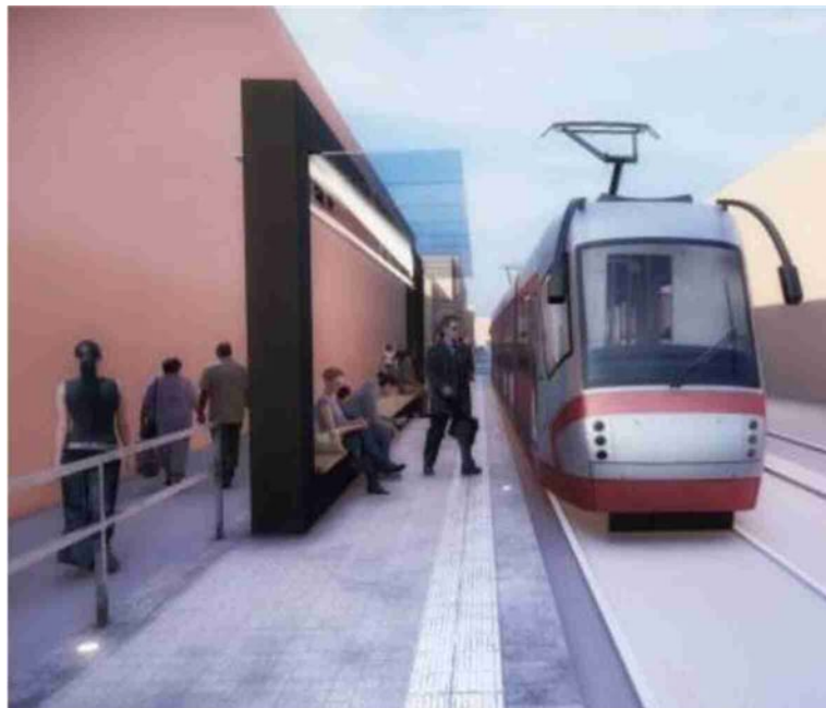
Il rendering della linea rossa del tram che collegherà Borgo Panigale al Caab