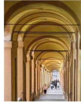
Portici patrimonio Unesco dal 2021

colo dell'Università e l'Accademia filarmonica, senza contare i tanti festival internazionali e l'offerta culturale continuativa.