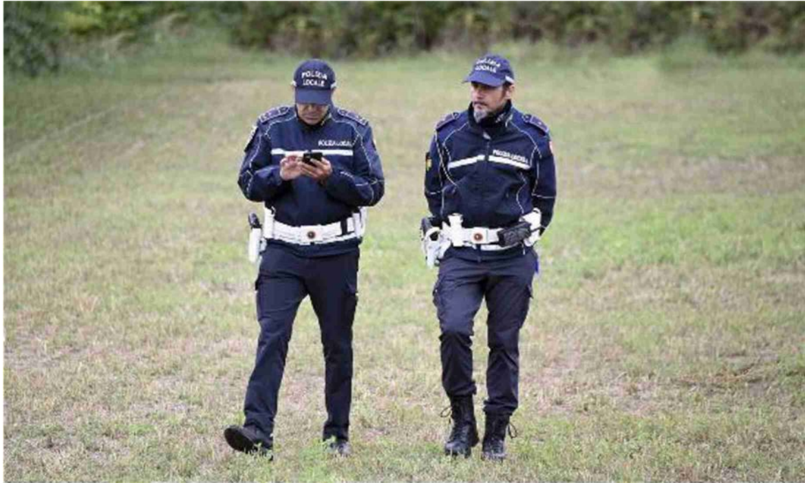
Nell'immagine di archivio, controllo della polizia locale in un parco urbano

La ragazzina, 16 anni, ha chiesto il gratuito patrocinio di un legale perché non ha soldi