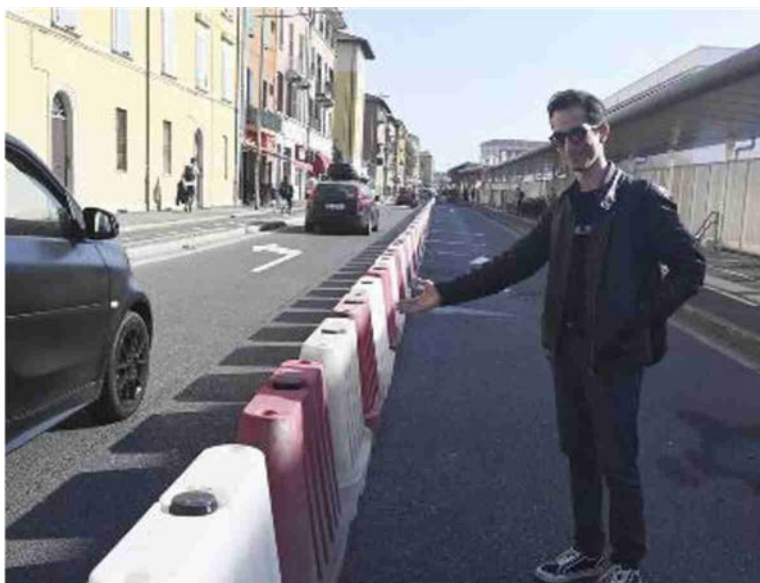
La fila di dissuasori tipo new jersey installati martedì in via de' Carracci