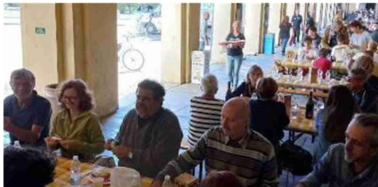
La grande partecipazione al pranzo organizzato sotto i portici a Gualtieri