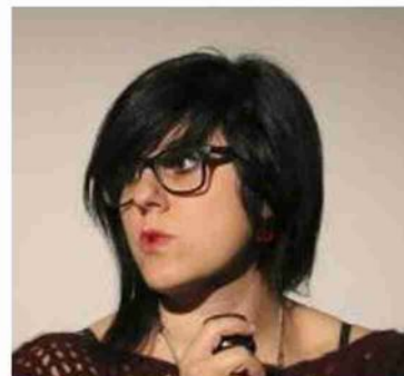
Marte Bernardi del Cinema Galliera