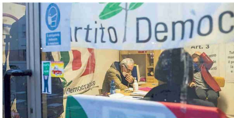
▼ Il circolo La sede Pd di via Casarini