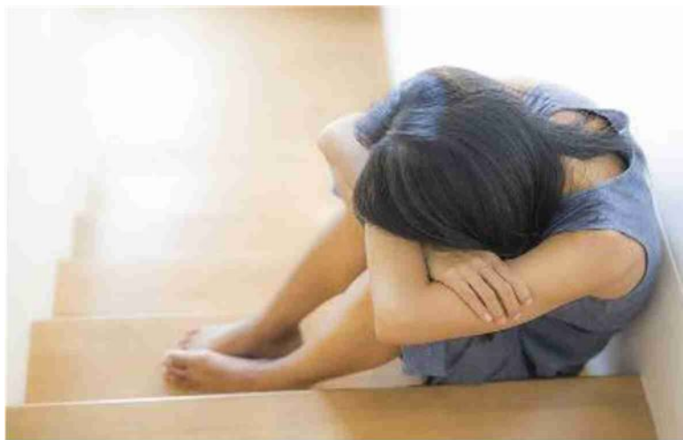
Il contrasto alla violenza sulle donne è tra le priorità delle istituzioni

struzione del documento. «L'obiettivo - continuano gli organizzatori - è quello di migliorare la qualità della vita della comunità attraverso la decostruzione degli stereotipi sessuali e di genere e la trasformazione dei modelli culturali dominanti di matrice patriarcale. Allo stesso tempo si vuole mantenere ferma attenzione sulle esigenze di protezione e di sostegno alle donne che subiscono violenza, ai loro figli e sull'offerta di percorsi e trattamenti per gli uomini che agiscono violenza». E aggiungono: «Per realizzare questo obiettivo è fondamentale il gioco di squadra con Città Metropolitana e Regione. Enti che possono dare indicazioni, strumenti utili, sostegno politico e contributi economici».