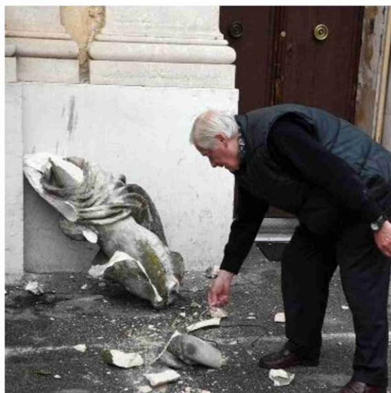
Una delle tante ferite inflitte dal terremoto del 2012 a San Giovanni in Persiceto

A Pieve messa nella Collegiata A Crevalcore confronto e ricordi con Bonaccini