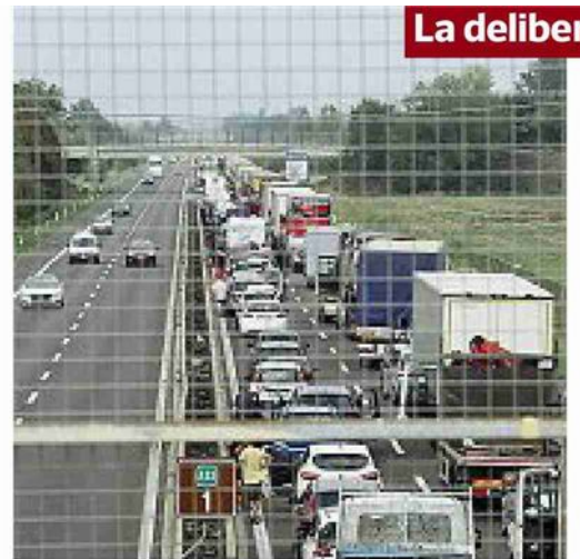
L'A13 è l'unica del nodo di Bologna ancora a due corsie

Una delibera del Comune apre la strada all'allargamento dell'A13 Bologna-Padova. La realizzazione della terza corsia prevede il via libera agli espropri dei terreni e le opere green: barriere anti rumore e nelle intenzioni del Comune il fotovoltaico. a pagina 5