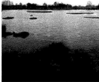
Un'immagine dell'isola ecologica

aperti tutti i giorni, dall'alba al tramonto, e in autunno e primavera l'offerta si arricchisce con le visite guidate delle «Domeniche all'Oasi». Le 'Domeniche all'Oasi' sono gratuite e non necessitano di prenotazione: basta presentarsi al Centro Visite (via Bassa degli Albanelli 13) al mattino alle 9.30 o al pomeriggio alle 14.30, e attendere la partenza del gruppo. Il calendario delle 'Domeniche all'Oasi' per la primavera 2022 prosegue tutte le domeniche fino a domenica 19 giugno.