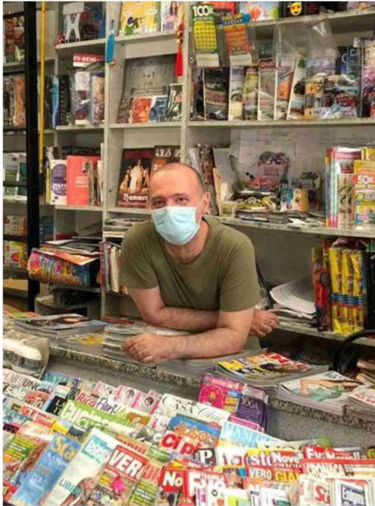
Nel nostro elenco ci sono tutte le edicole aperte domani, Comune per Comune