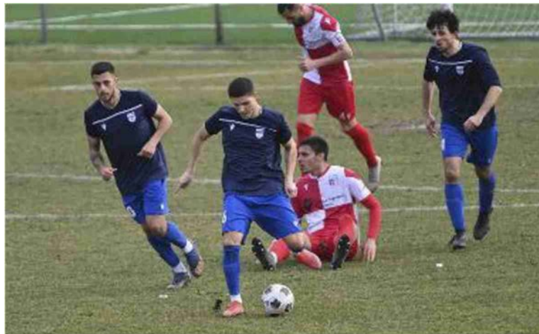
Una fase di gioco di una delle ultime gare disputate dal Progresso di Castel Maggiore contro la formazione del Rimini, al top nel campionato di serie D