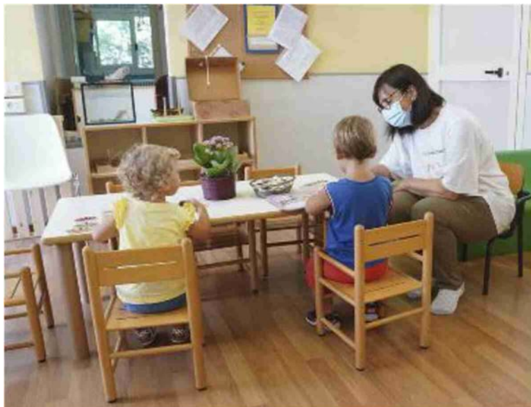
Il provvedimento riguarda i nidi e le scuole d'infanzia comunali

«Un'operazione di correttezza nei confronti dei contribuenti»