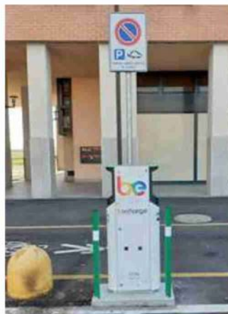
La colonnina di Sant'Agostino