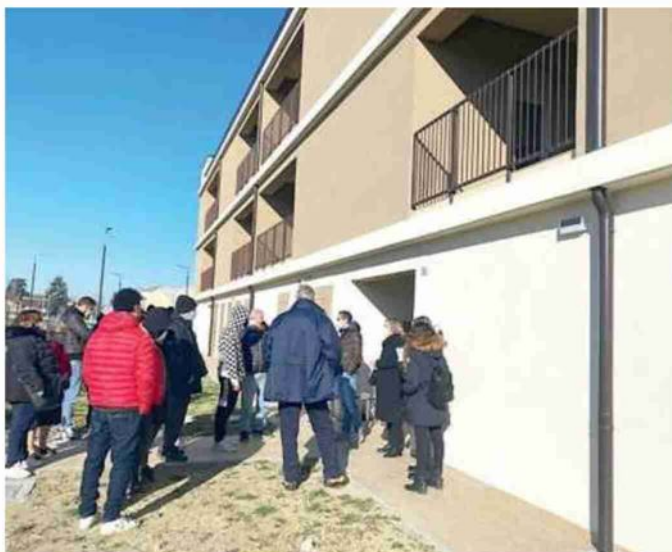
Mercoledì mattina l'ingresso nella palazzina di via delle Mondine