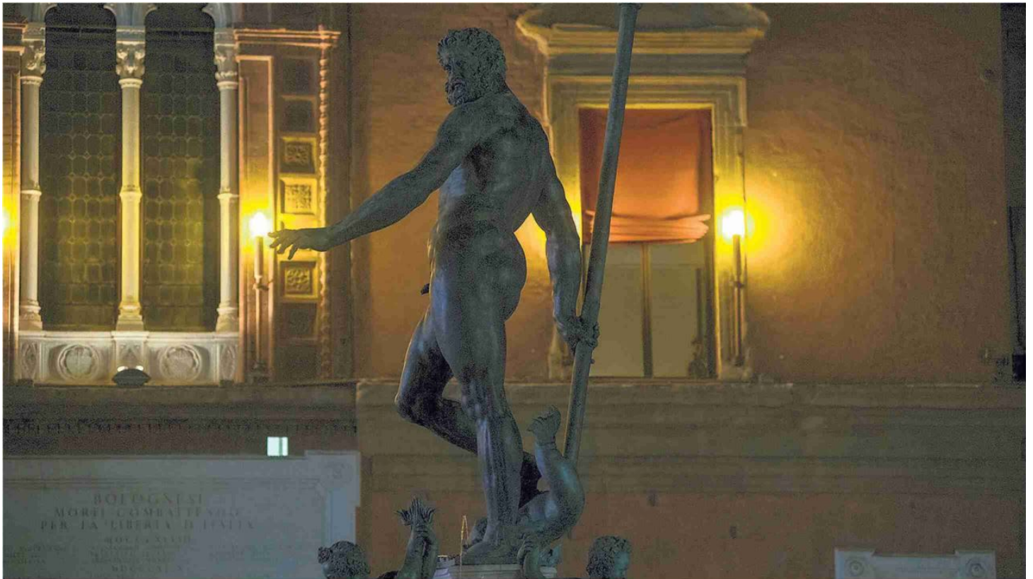
▲ Il Dio del mare Il Nettuno, illuminato ieri solo dalle lampade sullo sfondo

di Marco Bettazzi, Eleonora Capelli e Ilaria Venturi • pagine 2 e 3