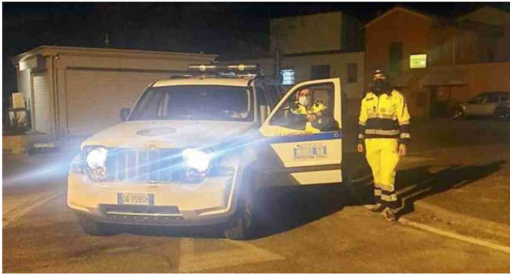
Dall'alto riunione nella sede della Protezione civile di Cento e la Protezione civile attivatasi a Pieve