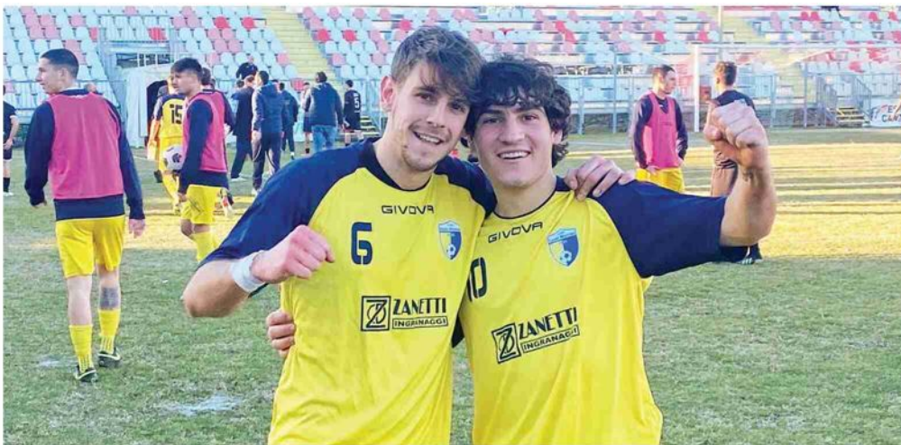
Colarieti e Monti del Sasso Marconi dopo la vittoria di ieri

Dopo il ko dell'andata, il Progresso cede anche allo Zucchini di Budrio Monti firma il vantaggio per il Sasso, Draghetti la chiude oltre il 90'