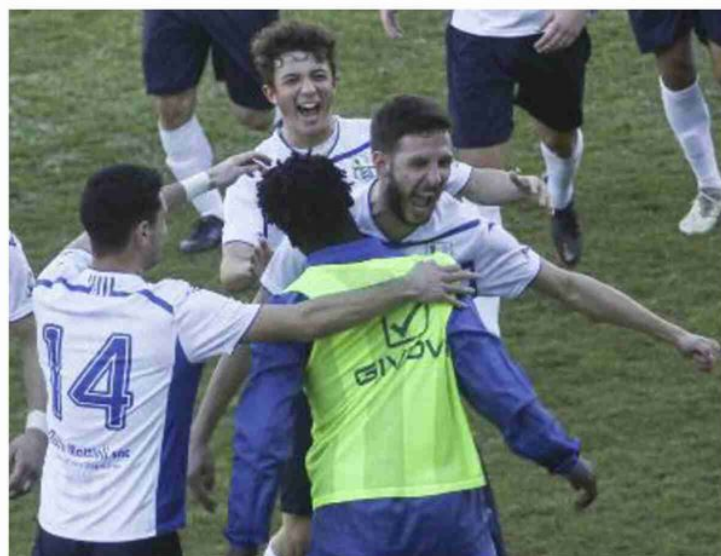
I compagni abbracciano Motolese dopo il gol che ha steso il Progresso (Schicchi)

Per la squadra budriese c'è Ravenna, rossoblù per il riscatto contro l'Aglianese