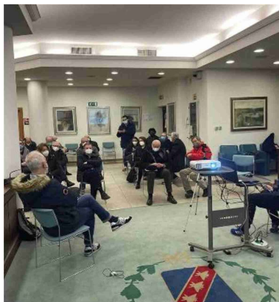
L'assemblea degli amministratori comunali con un gruppo di residenti di Sabbiuono

Nel centro abitato saranno rifatti i percorsi pedonali, le fermate dei bus e un marciapiede