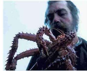
Il film "Re Granchio"

Luciano, che per amore compie un gesto estremo e da un piccolo borgo della Toscana di fine Ottocento fugge fino alla Terra dei fuochi, dove diventa cercatore d'oro. Cinema Lumière, piazzetta Pasolini, ore 20