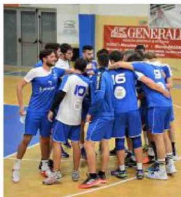
Il Prime Cleaning Riccione