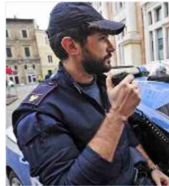
L'uomo fu arrestato dalla polizia

struzione dei fatti, facendo emergere un rancore, che la donna avrebbe avuto nei confronti dell'amante, perché quest'ultimo avrebbe intrattenuto, contemporaneamente, più relazioni.