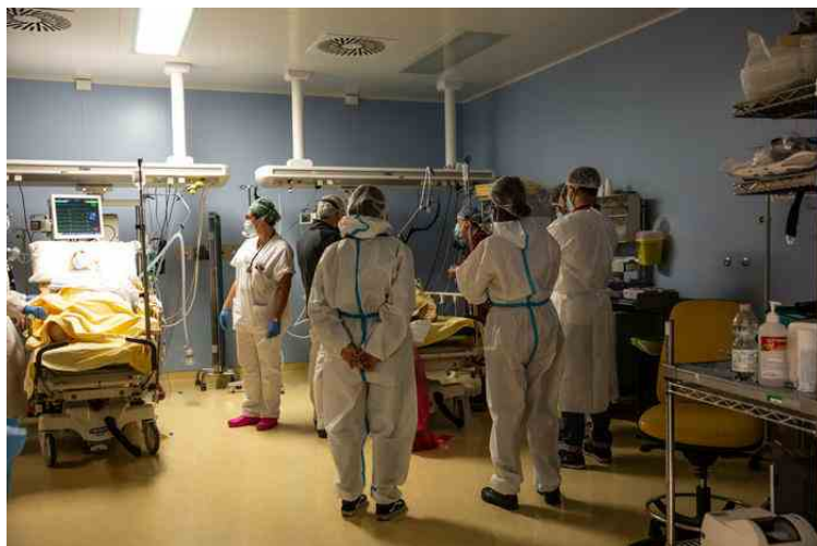
Terapia intensiva a Bologna