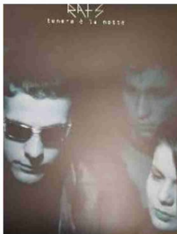
La copertina del disco