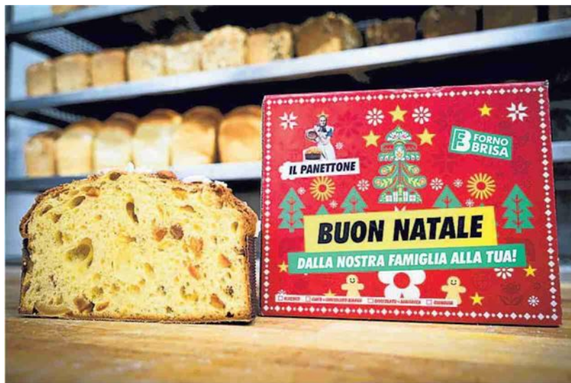
▲ Il panettone del Forno Brisa

Piccola guida al dolce delle feste e alle botteghe che lo preparano in tanti modi diversi