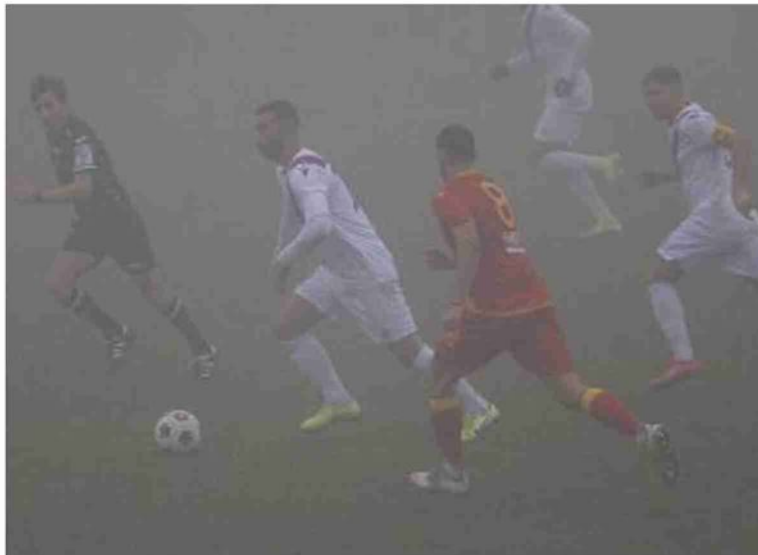
Un'azione della partita con il Progresso in attacco contro il Ravenna

Reti: 20' pt Bagatti, 31' pt rig. Saporetti. Note: ammoniti Bagatti, Rizzi, Rossi, Antonini Lui, Saporetti, Podestà.