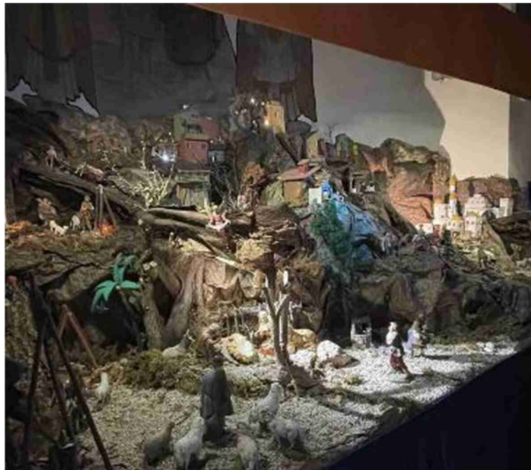
Le statuine del presepio che viene inaugurato questa mattina in via Bologna