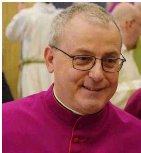
Fabbri era anche direttore dell'Istituto diocesano per il sostentamento del clero

Il cardinal Zuppi ha inviato un messaggio alla diocesi invitando tutti a pregare per il sacerdote