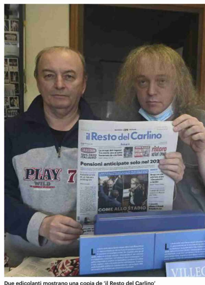
Due edicolanti mostrano una copia de 'il Resto del Carlino'

Cronaca, politica, economica, sport, spettacoli, cultura e intrattenimento per i lettori