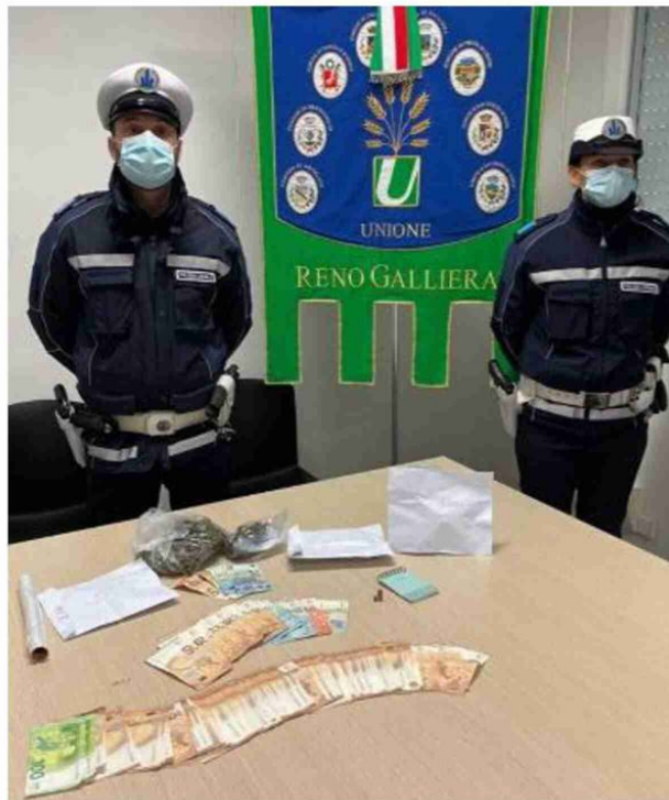
La polizia locale della Reno Galliera con gli stupefacenti e le banconote sequestrate durante l'operazione

Uno degli spacciatori ha cercato di investire un agente forzando il posto di blocco