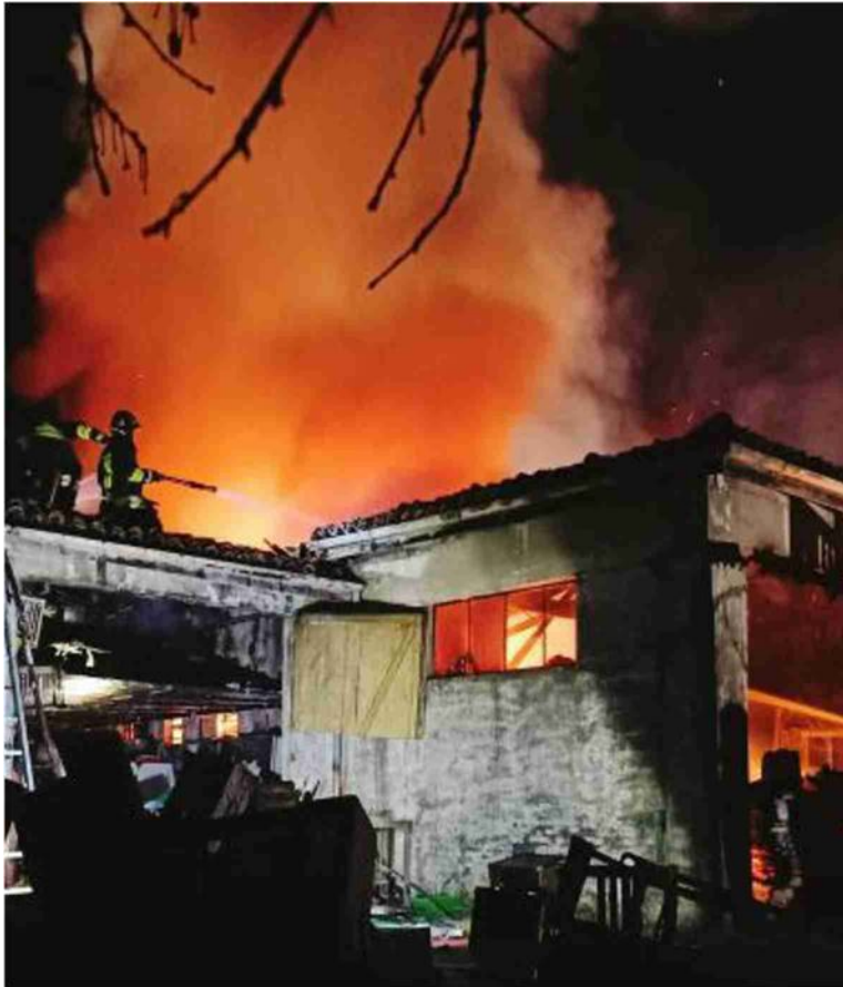
Le immagini del rogo a Bazzano