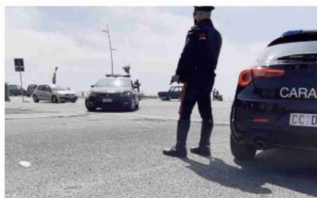
Rapina da film 'crime', l'altra sera, a Castel Maggiore. Sono intervenuti i carabinieri