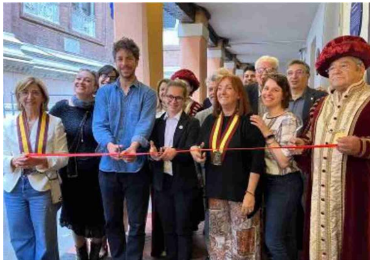
Il taglio del nastro della Via dei Brentatori avvenuto ieri a Bologna