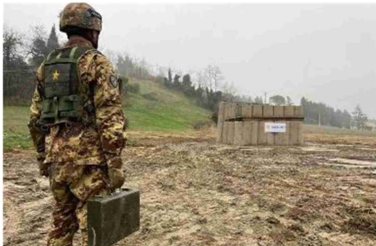
L'esercito italiano disinnescerà l'ordigno della Seconda Guerra Mondiale

Le operazioni di disinnescamento avranno inizio alle 8 di domenica mattina