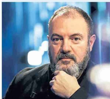
▲ Scrittore Carlo Lucarelli