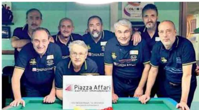
La squadra della DM Confezioni Tex Master Novellara