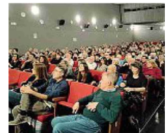
Il pubblico La sala ghermita del Bellinzona