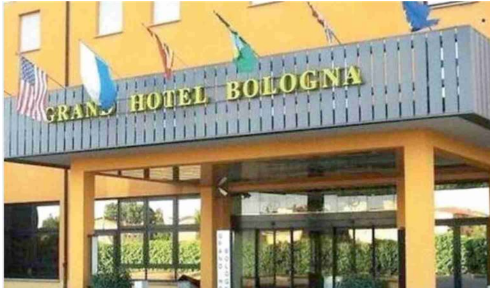
L'ingresso del Grand Hotel Bologna che tornerà all'asta: per comprarlo servono oltre 3 milioni