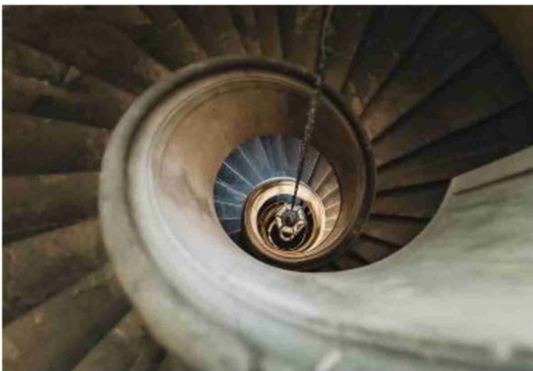
La scala elicoidale realizzata dal Vignola a Palazzo Boncompagni