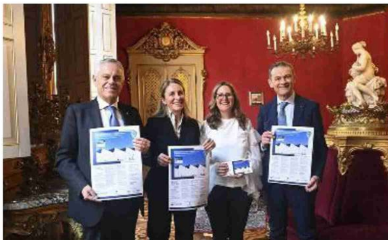
La presentazione in Ascom della manifestazione 'aMa Bologna'