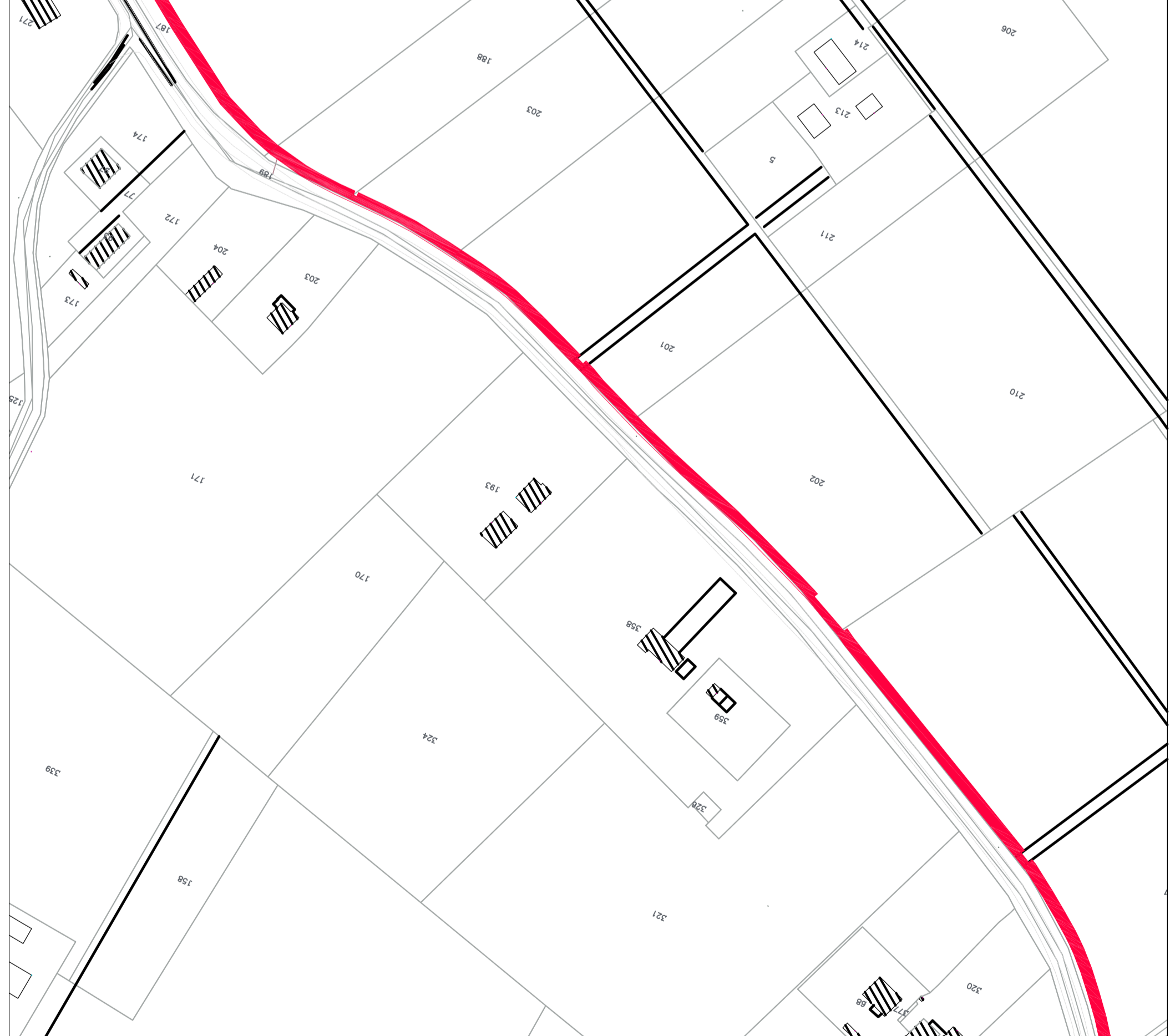
Comune di ARGELATO FG. 7