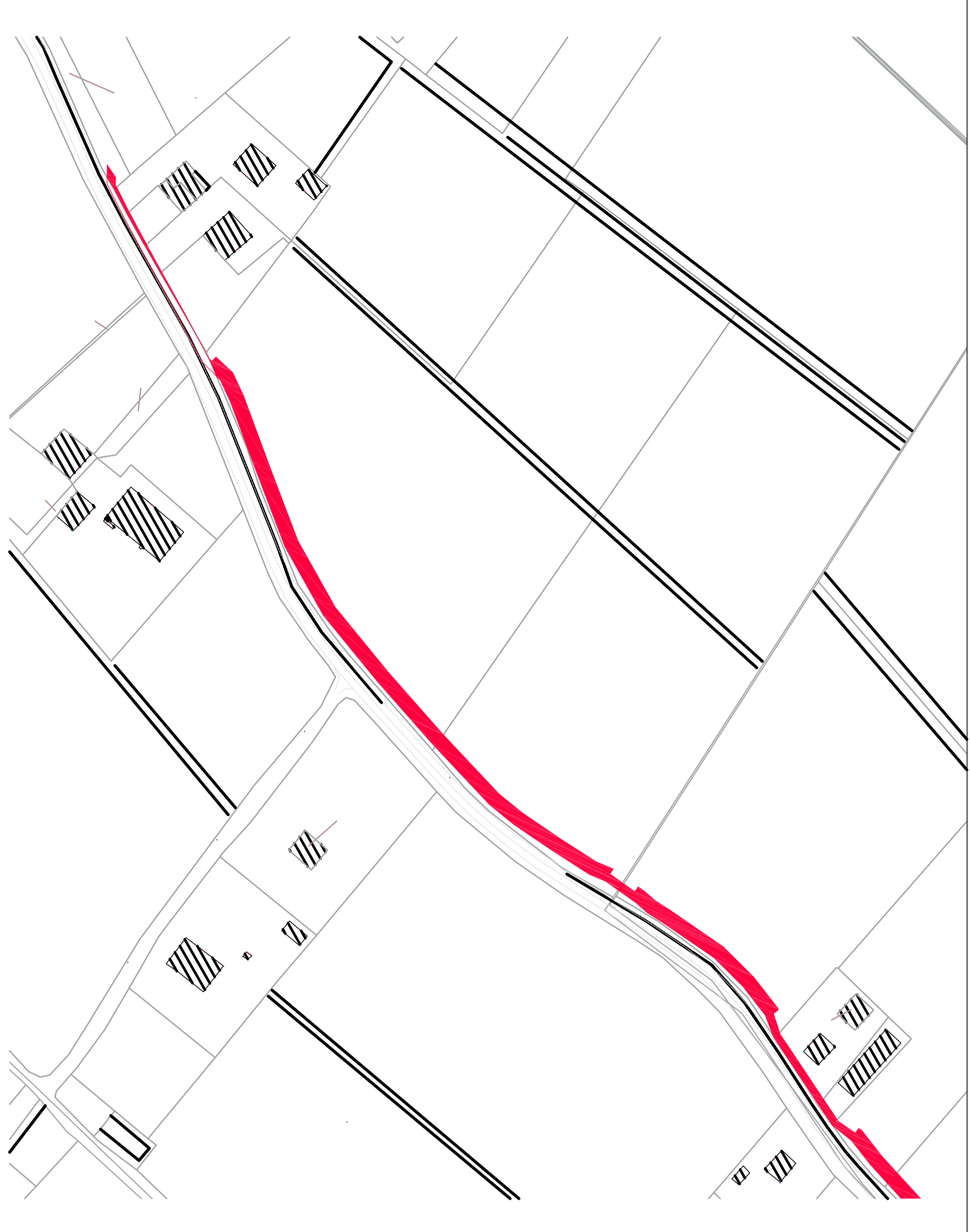
Comune di ARGELATO FG.15

superficie di esproprio superficie su sedime pubblico